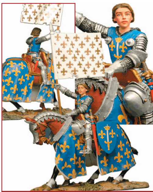
Pictos : Christophe Brugère